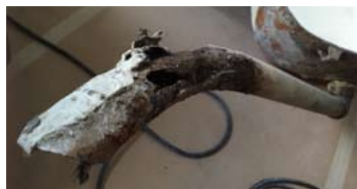
Röret från badkaret till avloppsbrunnen hade rostat sönder och läckande vatten orsakade skador i medlemmens hela lägenhet.

Föreningen har under det gångna året drabbats av kostbara vattenskador. Den största boven i dessa dramor har visat sig vara rostiga och/eller dåligt förankrade avloppsrör under inbyggda badkar. Badvattnet har alltså inte runnit ut i golvbrunnen, utan blivit stående under badkaret tills det funnit annan väg därifrån. Ytskadorna ingår i varje medlems bostadsrättsförsäkring, medan allt som blir förstört under ytskiktet, såvida skadan inte beror på oaksamhet, faller på föreningens lott.