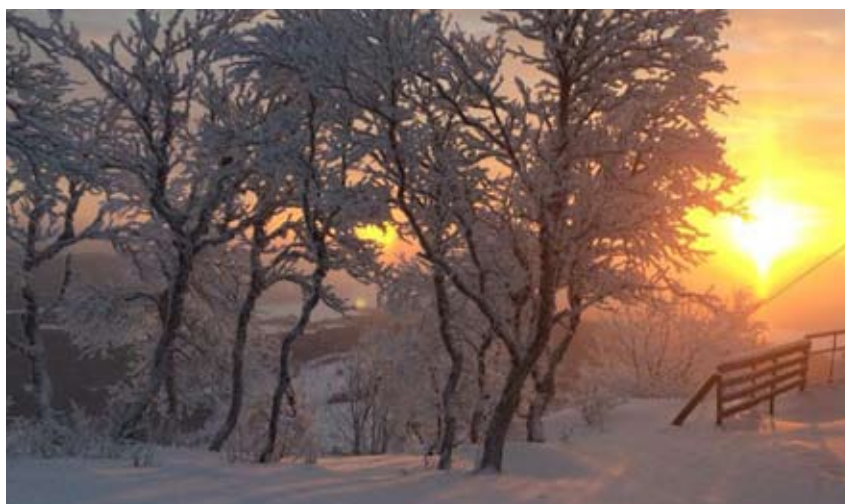
Dagarna kommer om natten. I varje vinter finns en gullvivad vår.

Om du gör allt rätt men någon granne ändå får in rök i sin lägenhet, ska du låta brasan falna och vid tillfälle kontakta styrelsen.