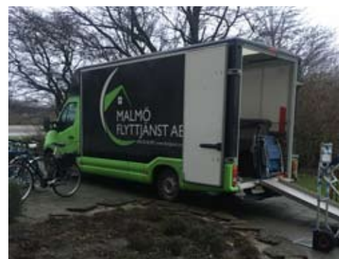
Bara räddningsfordon får köra på entrésidan.

Vilken flyttfirma du som boende anlitar kan styrelsen inte lägga sig i, men vi kan i alla fall inte rekommendera detta företag som öppet trotsar husets regler och betar sig oprofessionellt.